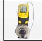
Fondina da cintura