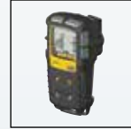
Guscio di protezione antiurto

Per un elenco completo degli accessori contattare BW Technologies by Honeywell.