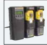
Compatibile con MicroDock II