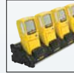
Caricabatteria da tavolo per multi-unità